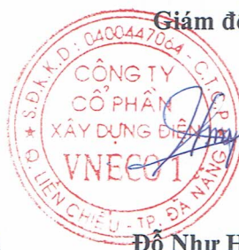
Đỗ Như Hiệp